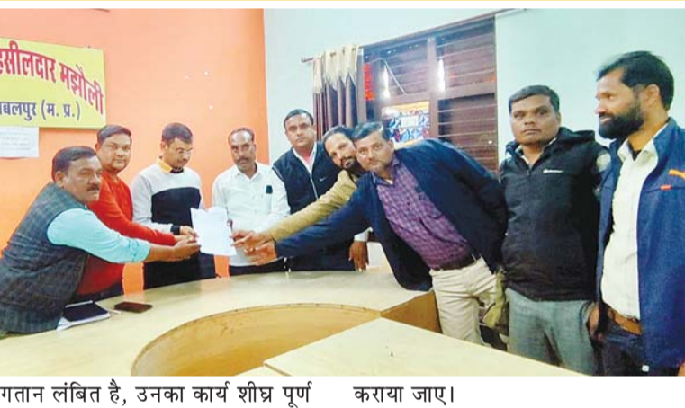
भुगतान लंबित है, उनका कार्य शीघ्र पूर्ण कराया जाए।

मझौली। भारतीय किसान संघ मझौली द्वारा जिला कलेक्टर के नाम तहसीलदार मझौली को ज्ञापन सौंपा गया। ज्ञापन में बताया गया कि श्री जी वेंचरहाउस खरीदी केंद्र में 13 जनवरी से पोटल बंद होने के कारण कई किसानों की धान तुलाई के बावजूद पोटल में नहीं चढ़ पाई है। संघ ने यह भी बताया कि अनेक किसानों को अब तक उनकी धान का भुगतान नहीं किया गया है, जिससे किसान आर्थिक परेशानियों का सामना कर रहे हैं। भारतीय किसान संघ मझौली ने शासन-प्रशासन से मांग की है कि जिन किसानों की धान पोटल में दर्ज नहीं हुई है तथा जिनका